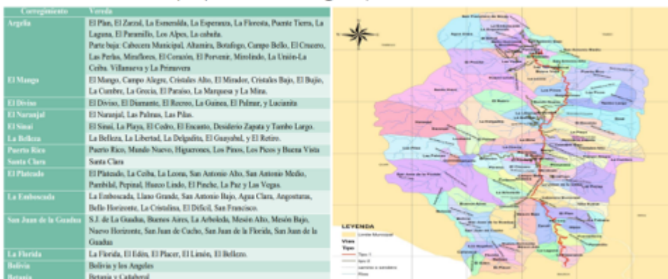
Mapa político de Argelia, Cauca

Las mínimas posibilidades de actividades agropecuarias por las condiciones del suelo son