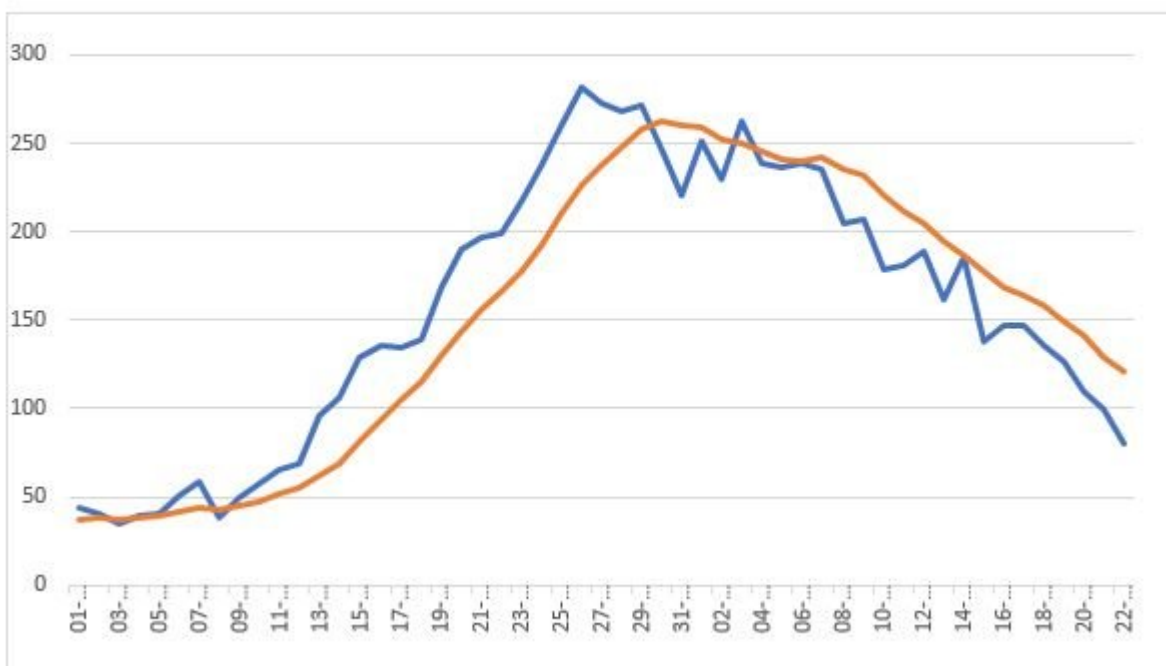
Gráfico 2 Muertos diarios por Covid-19 del 1 de enero al 22 de febrero de 2022

Bogotá sigue explicando el 42% de los infectados diarios