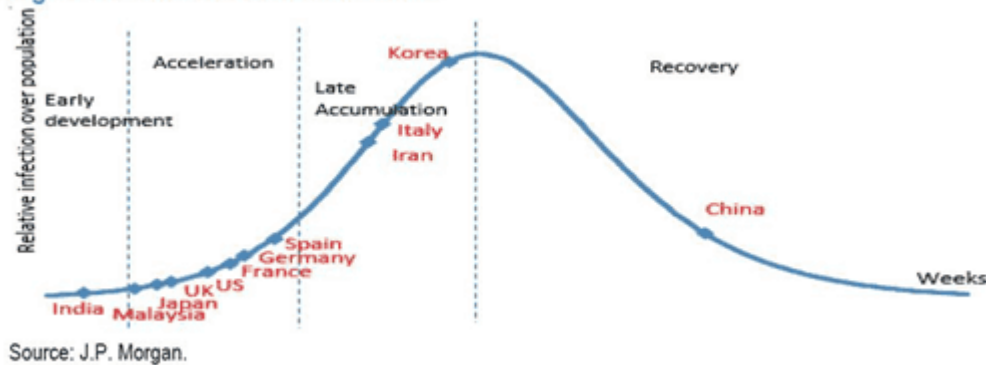
Figure 1: COVID-19: Schematic chart

El coronavirus en su “recorrido” hace su entrada a Italia, vía la Nueva Ruta de Seda, afectando luego a España (6,368 nuevos casos en 24 horas), Alemania (4,183 casos), Francia y Reino Unido, países todos que se encuentran en la primera fase de aceleración. La segunda fase de aceleración exponencial es bien crítica ya que al fallar la recuperación, la situación se torna realmente grave para la población y la nación. Finalmente consideramos que EEUU (con 13,060 casos diarios el 23 de marzo), al igual que la India y muchos países latinoamericanos se encuentran todavía en la fase inicial de la llamada ‘pandemia’.