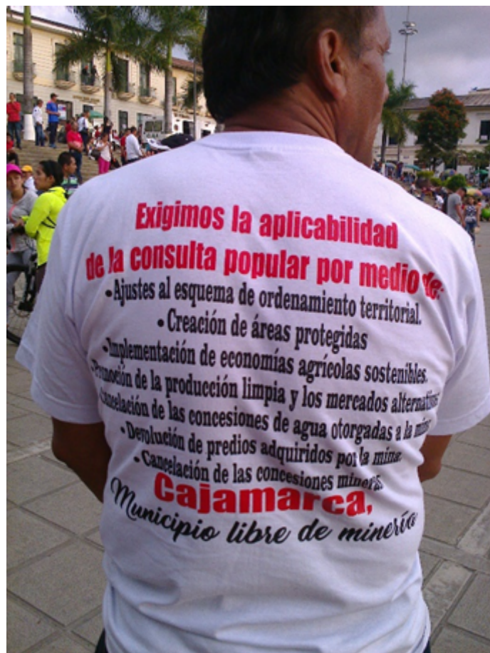
Ciudadano de Cajamarca

El jóvenes de Ibagué, miembros del Comité Ambiental, recorrieron varios barrios animando a la votación.