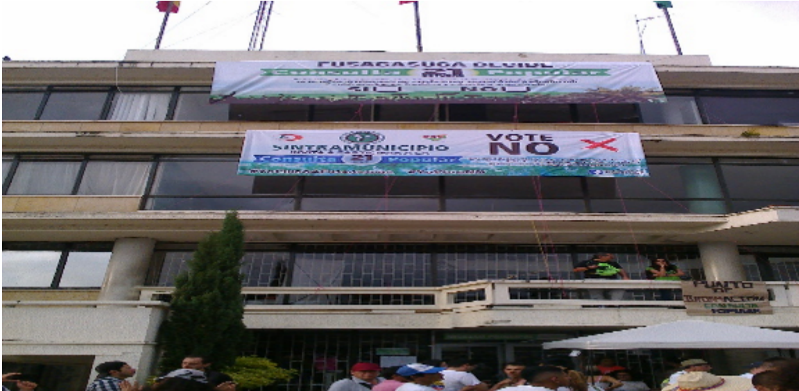
Fachada del Centro Administrativo Municipal

La municipalidad no se limitó solamente a la convocatoria sino que trabajó con mucho empeño con el proceso ciudadano. Las instituciones educativas, escuelas y colegios, y la Universidad de Cundinamarca no ahorraron esfuerzos en el proceso concientizador de la juventud y de la población.