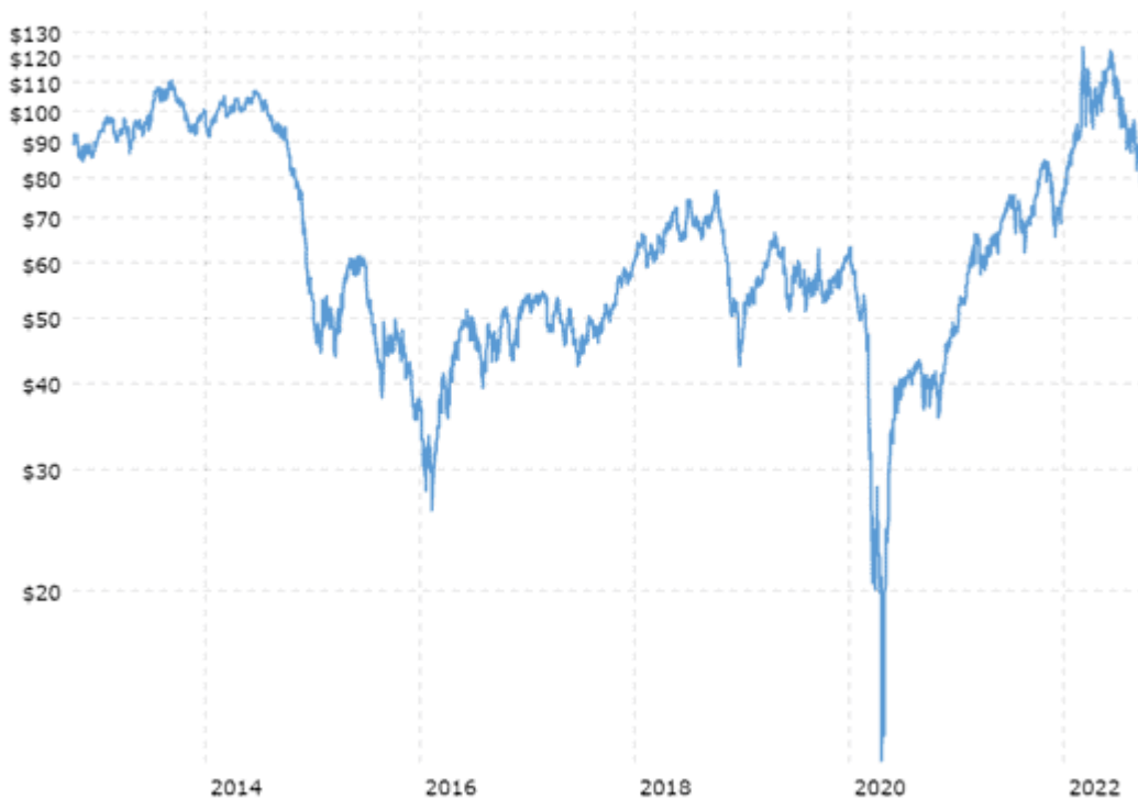
Gráfico 1 Evolución del precio del petróleo WTI en dólares por barril

Hay que revisar la teoría y la práctica sobre los precios de los combustibles, el GLP, el gas natural y la energía eléctrica