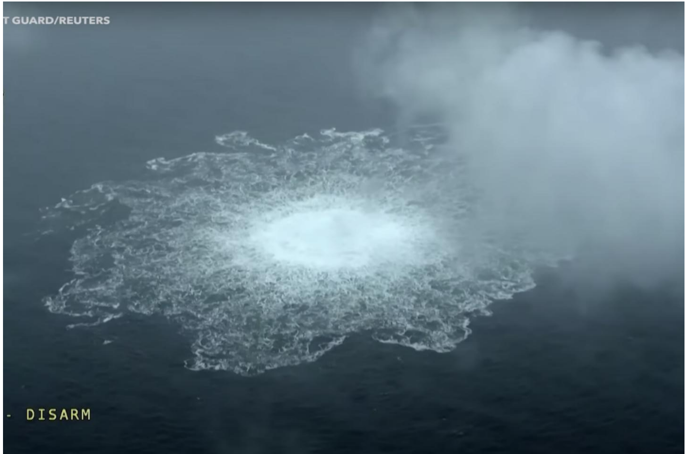
Imagen de la guardia costera de Suecia de la fuga de gas de los oleoductos Nord Stream en el Mar Báltico, el 29 de septiembre de 2022.

Los trabajadores alemanes se han visto aún más afectados por la llegada masiva de refugiados ucranianos. Eso ha aumentado una competencia salarial a la baja y ha creado una escasez de viviendas que ha incrementado los alquileres. También ha provocado la saturación de las escuelas y los servicios sociales. En menor medida, lo mismo afecta a todos los trabajadores europeos.