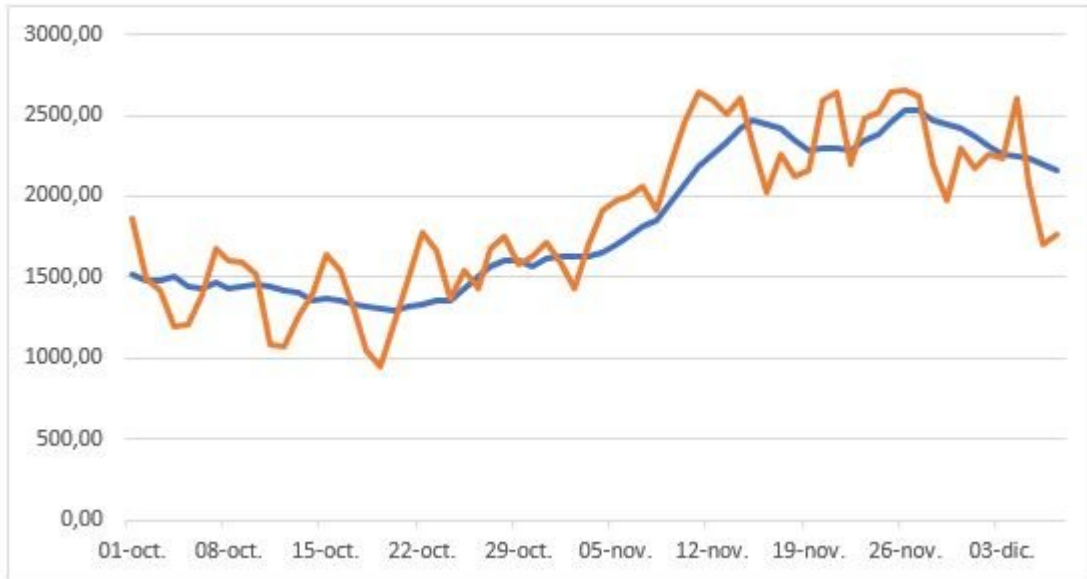
Gráfico 1 El Covid-19 a nivel nacional del 1 de octubre al 7 de diciembre