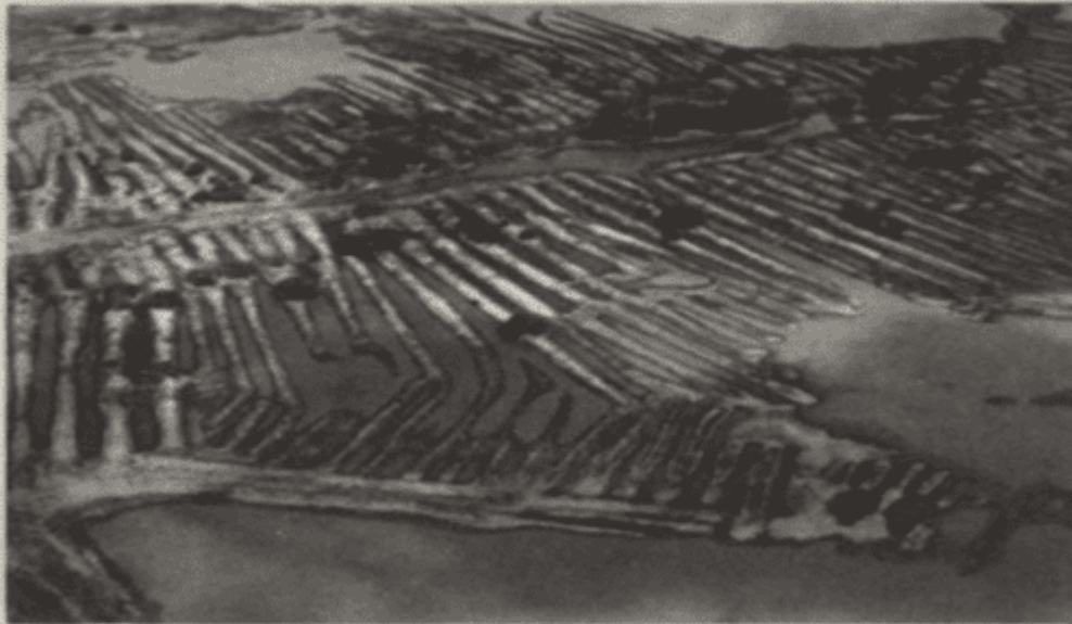
Fig. 3. Canales artificiales de drenaje en el bajo río San Jorge.

desarrollar la agricultura". ¿Por qué no volvemos a esas fuentes?