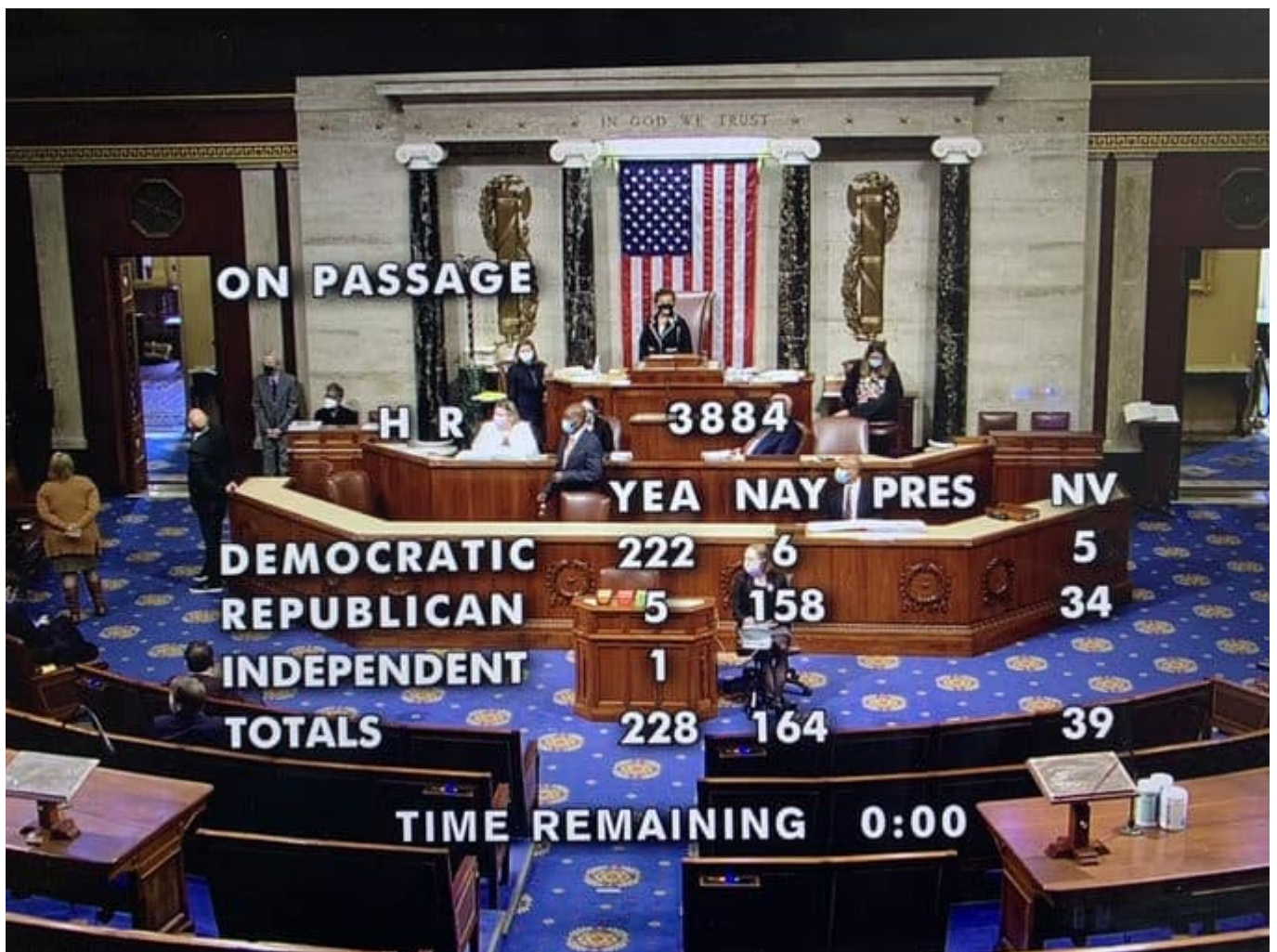
Imagen capturada de señal de televisión de sesión de House of Representative (internet)

es una conducta criminal, pero no puede ser un comportamiento socialmente aceptable en algunos barrios y una conducta criminal en otros cuando la línea divisoria es la raza, y por eso debemos aprobar (esta ley), despenalizar la marihuana en Estados Unidos y dar vida al principio de libertad y justicia para todos” dijo Earl Blumenauer congresista demócrata de Oregón.