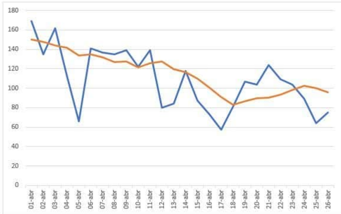
Gráfico 2 Infectados diarios en Bogotá del 1 de enero al 26 de abril de 2022