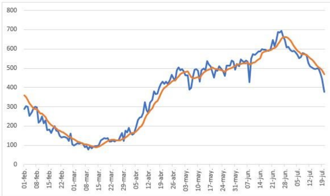
Gráfico 4 Evolución de los muertos diarios en Bogotá del 1 de febrero al 19 de julio de 2021 según cifras reales y por promedio de siete días